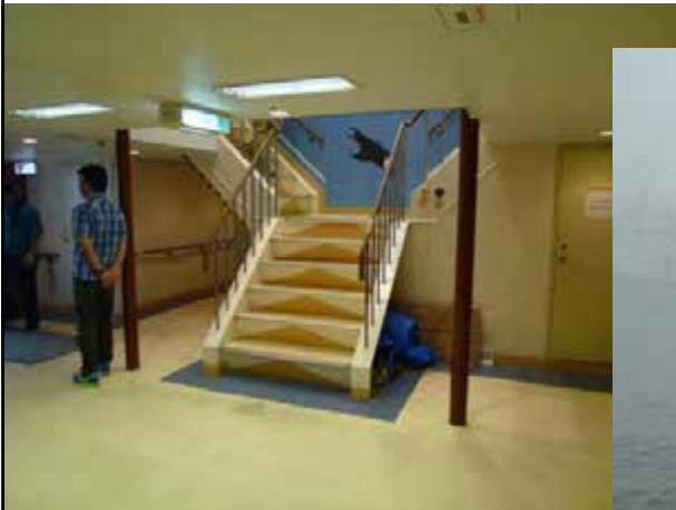
えとびりか号 船内