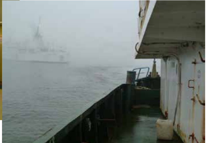
ロシア側の艇(はしけ)に移る