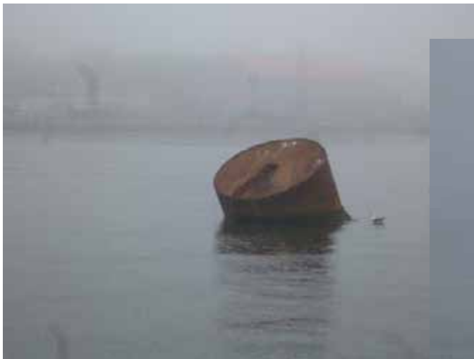
港内に放置された沈船